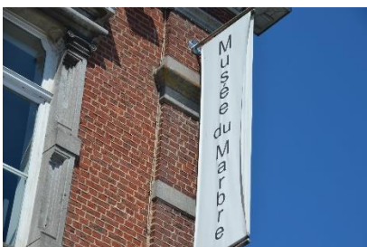
Het marmermuseum in Rance