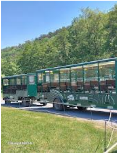
Het safaripark in Han-sur-Lesse