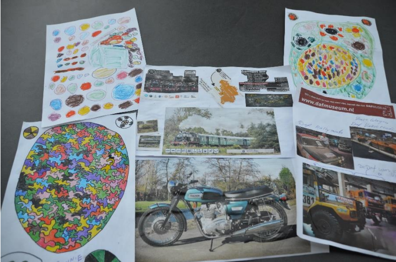
Mooie tekeningen en plakwerk gemaakt als cadeau voor de reisleiding.