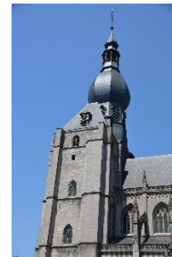
De stad Dinant