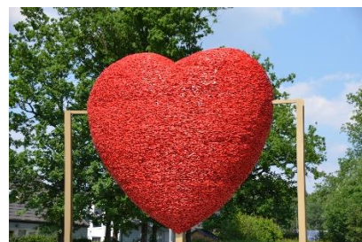
Bij de ingang van het park wachtte altijd het rode hart