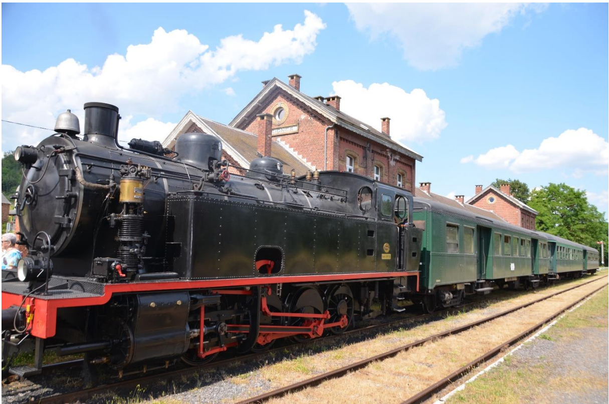
Nu met de passagiers wagen eraan