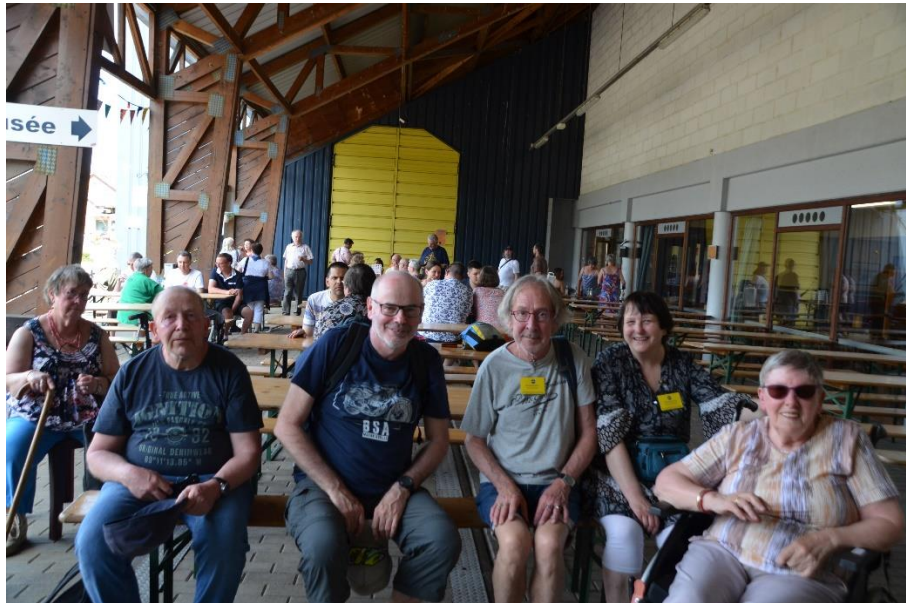
We moesten wel lang op de trein wachten