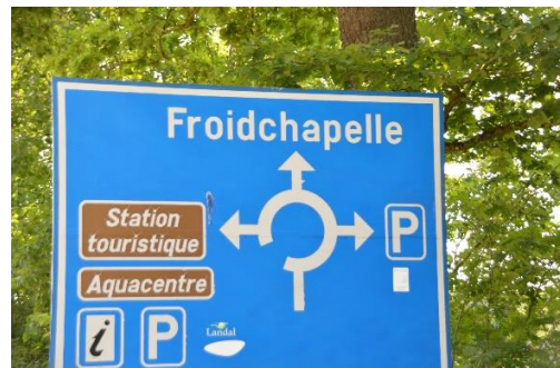
We zijn er bijna