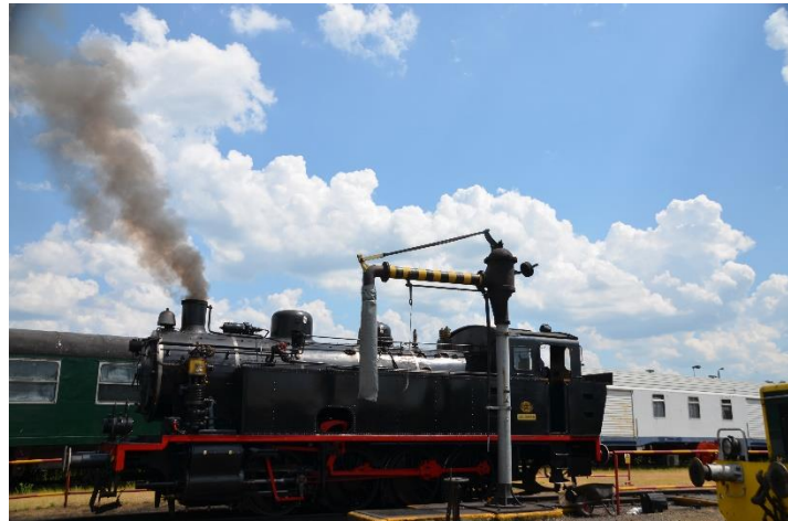
Met de stoomtrein van Mariembourg naar Treignes