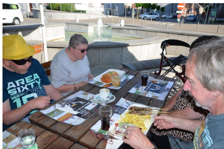
De pizzeria in Cerfontaine