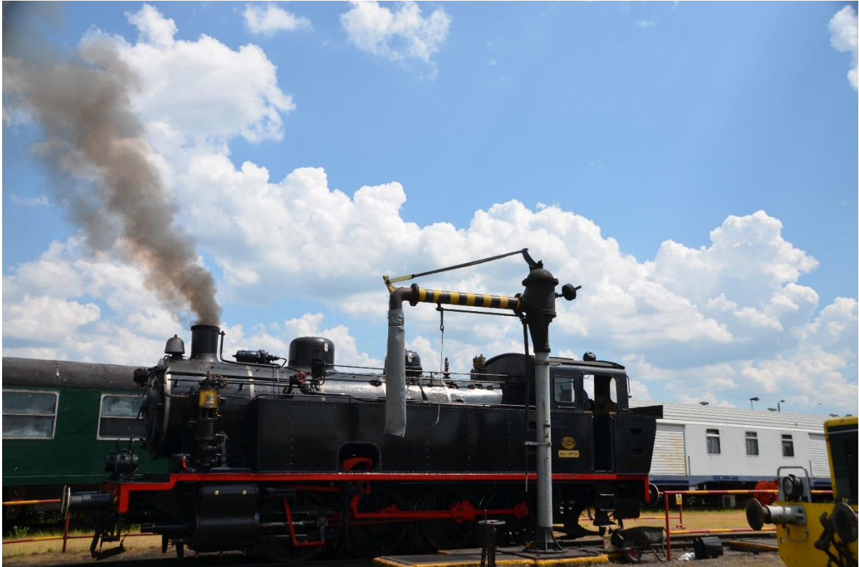
De trein stond klaar onder stoom