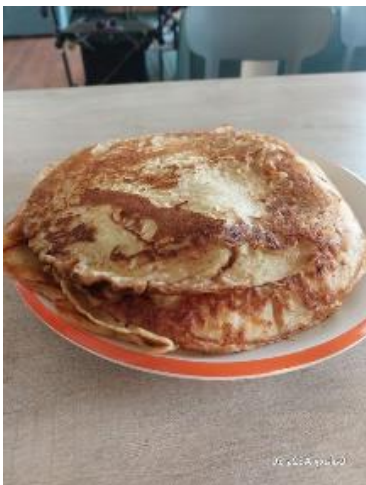
Pannenkoeken in het huis