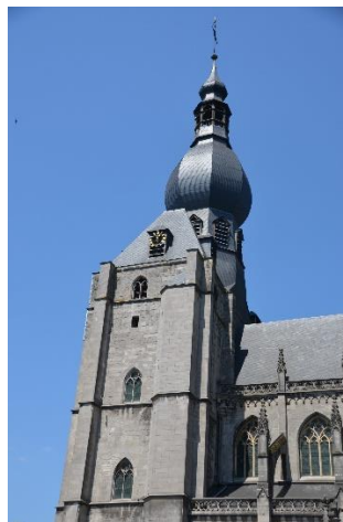
De citadel en de kerk van Dinant.