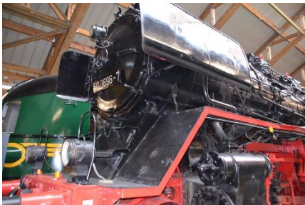
Het treinmuseum in Treignes