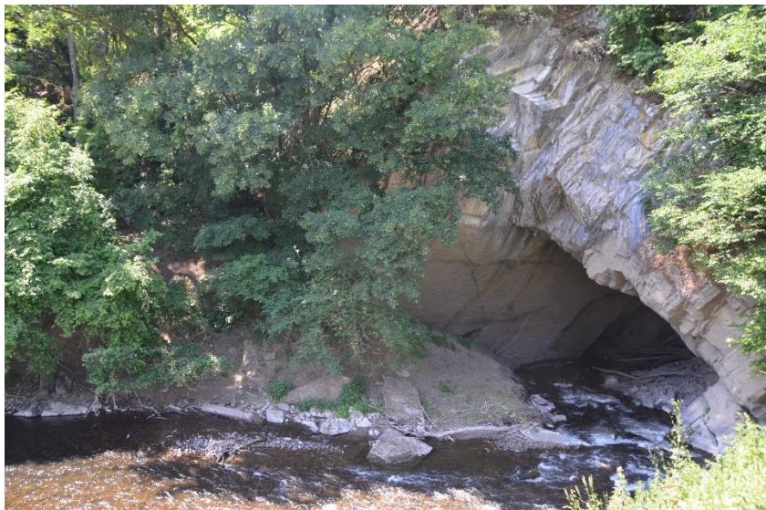
De ondergrondse ingang van de rivier de Lesse