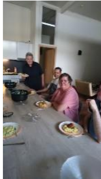
zomerstampot in het huis