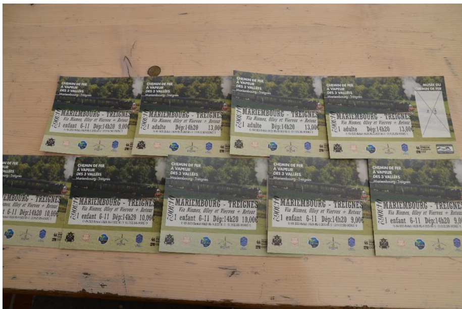
De kaartjes lagen klaar