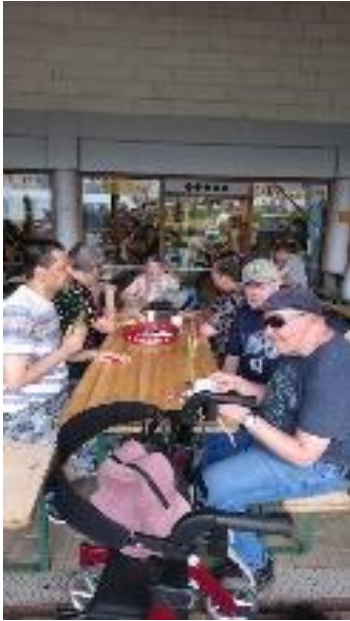
Friet in de snackbar van het park.