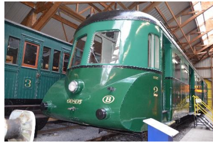
Het spoorwegmuseum en Wim met de pet van de conducteur.